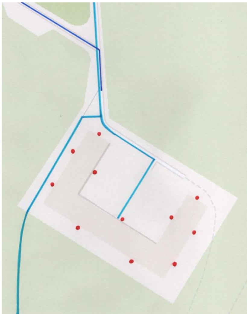
Схема организации дорожного движения в непосредственной близости от образовательной организации с размещением соответствующих технических средств организации дорожного движения, маршрутов движения детей и расположения парковочных мест