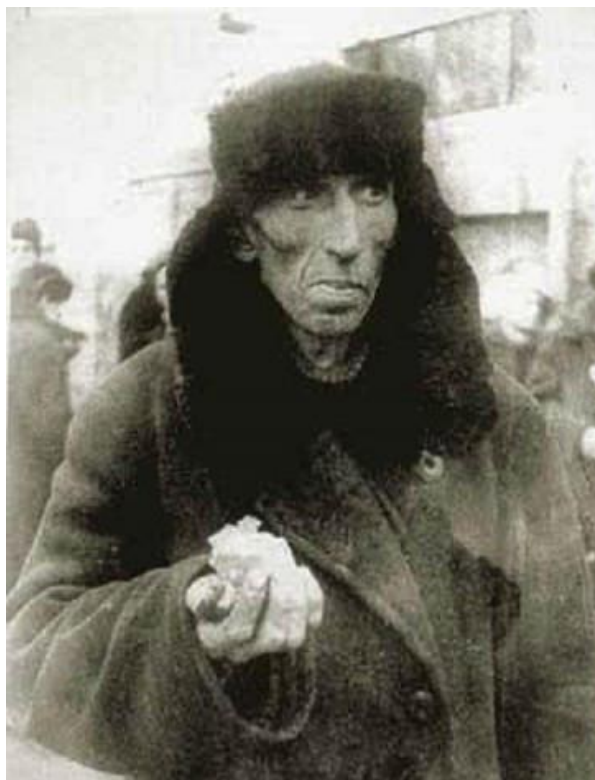
Самое страшное испытание

Ленинградцы начали получать такие карточки с 18 июля 1941 года. Июльскую норму можно назвать щадящей. Рабочим, например, полагалось по 800 граммов хлеба. Но уже к началу сентября ежемесячные нормы стали урезать. Всего понижений было 5. Последнее случилось в декабре 41-го, когда максимальная норма составила 200 граммов для рабочих и 125 для всех остальных.