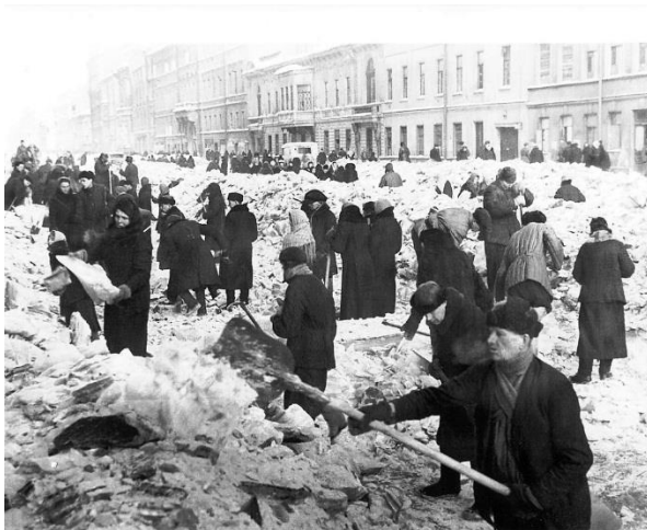
Жители Ленинграда разбираю завалы

Нам от него теперь не оторваться: Куда бы нас ни повела война – Его величием душа полна, И мы везде и всюду – ленинградцы.