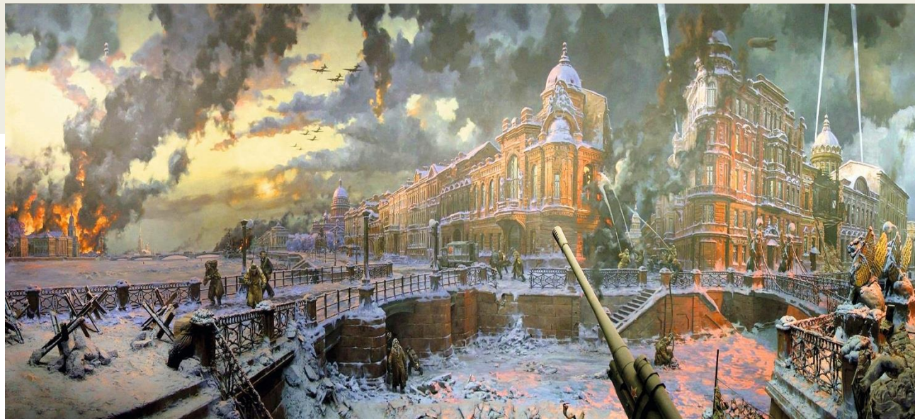
Диорама «Блокада Ленинграда»