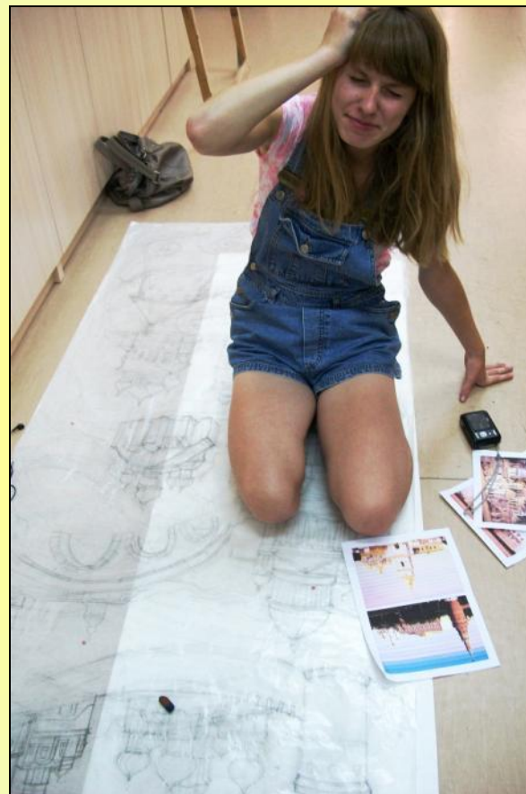
Работа над эскизом