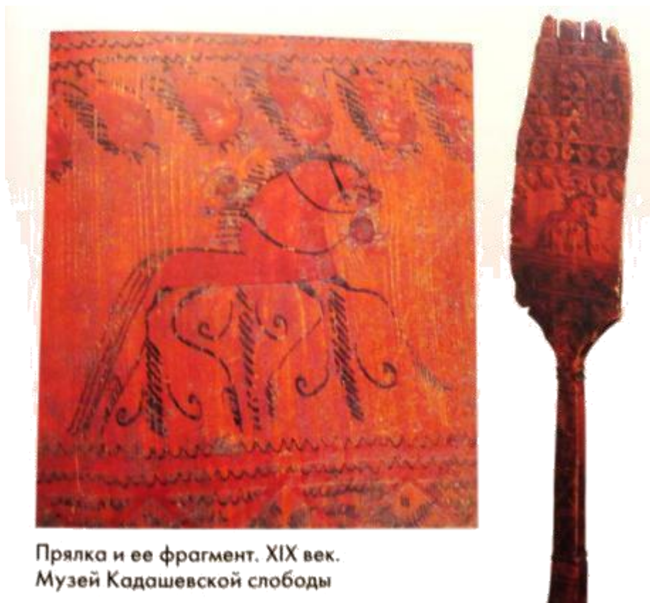
Прялка и ее фрагмент. XIX век. Музей Кадашевской слободы