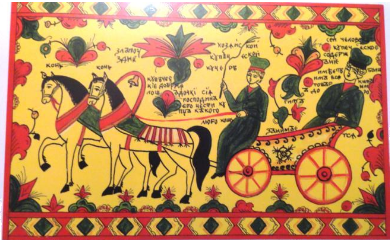
«Сцена вьезда». Копія фрагмента пермогорської пралки кінця XVIII — початку XIX віка