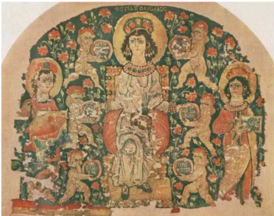
«Гестия, полный благословений» 44 x 53 дюймов. Египет, VI век.