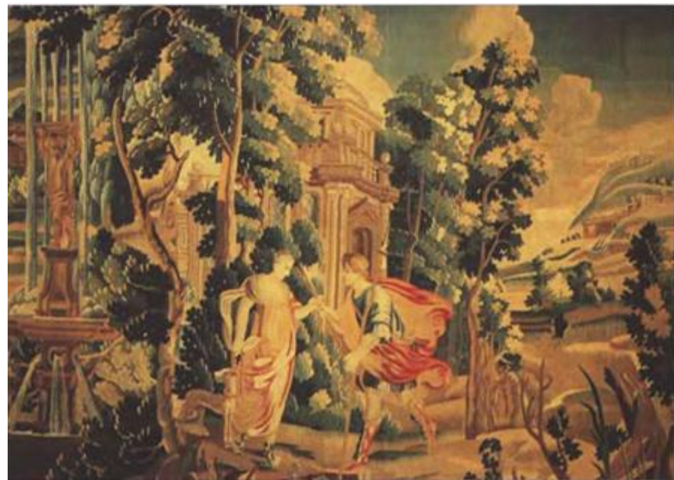
Иллюстрация к «Метаморфозам» Овидия. 1,9 x 2,4 м. Англия, около 1700 г.